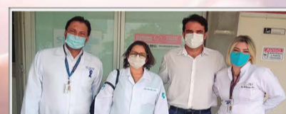
Sindimed-BA faz visita ao Hospital Geral de Camaçari