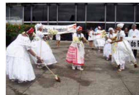
O ritual da lavagem contou com tudo que tem direito: baianas, água de cheiro e muita animação

• SESAB – Movimento Parar Para Acertar. O sindicato passou o ano de 2010 cobrando a efetiva implantação do PCCV dos servidores da SESAB, o que acabou não ocorrendo.