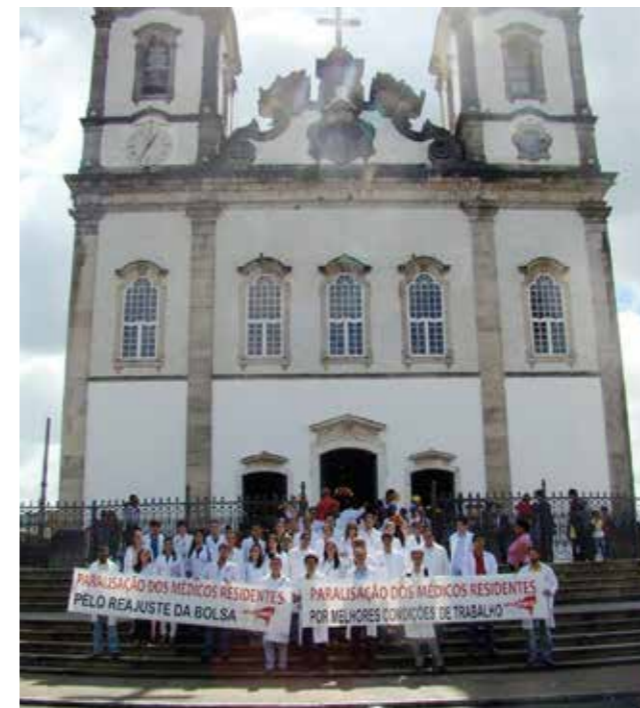
Manifestação na igreja do Bomfim

• APOIO À GREVE DOS RESIDENTES – Sindicato participa ativamente com apoio político e financeiro da mobilização dos médicos residentes, que culminou na greve de agosto daquele ano.