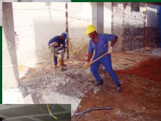
Os trabalhos de construção seguem instensos. O cronograma prevê a entrega da nova sede ainda este ano