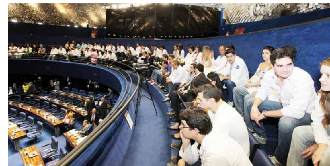
No dia 20 de agosto, centenas de médicos e de estudantes de medicina compareceram à Câmara Federal, onde o Congresso Nacional se reuniu para apreciar os vetos presidenciais

● SAMU – Foi necessária uma greve de 24 dias e a intermediação do Ministério Público para a prefeitura de Salvador minimizar a defasagem remuneratória dos médicos do Samu. O movimento capitaneado pelo Sindimed, chamou a atenção da mídia e realçou a importância do Samu para a população.