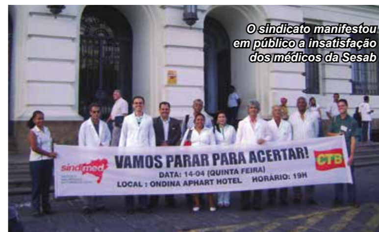
O sindicato manifestou em público a insatisfação dos médicos da Sesab