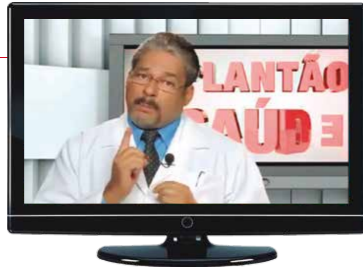
O personagem Dr. Milagres colocou o dedo na “ferida”, caiu no gosto da categoria e ganhou fama durante a campanha de mídia. Os médicos precisam, efetivamente, fazer milagres para manter o atendimento à população

● SESAB – Sindimed lança a campanha de mídia A Saúde na Bahia Precisa de Tratamento, de magnitude inédita, com direito a outdoors, inserções de rádio e TV, incluindo no Jornal Nacional, com custo acima de 150 mil reais, chamando a atenção da sociedade para os problemas do sistema de saúde na Bahia. O corolário é a aprovação de um acordo com o governo do Estado para um PCCV específico dos médicos.