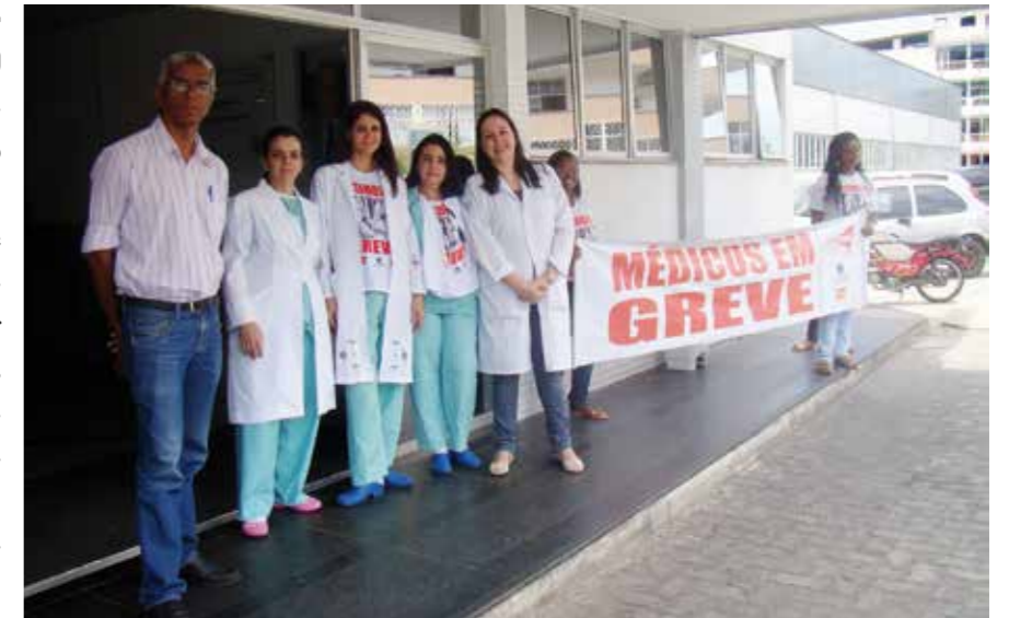
Médicos e Sindimed informam à população sobre a paralisação

O passivo trabalhista está sendo cobrado na Justiça.