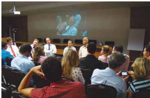
Assembleia, no dia 24 de janeiro, ouviu as argumentações dos gestores do Espanhol sobre os atrasos dos salários

● HOSPITAL ESPANHOL - Diante do atraso no pagamento dos salários e da falta de condições de atendimento, o Sindimed lidera uma greve na emergência com ampla repercussão social. Com isso, o poder público passa a dar suporte financeiro mediante contrapartida ao SUS, regularizando a situação dos pagamentos e melhorando, ainda que parcialmente, as condições de trabalho.