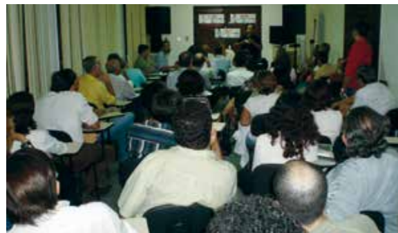
Auditório cheio, mobilização forte

A diretoria do sindicato percorreu hospitais e unidades de saúde convocando a mobilização e discutindo as reivindicações dos estatutários