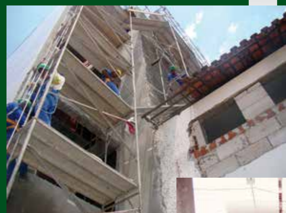
Um novo prédio está sendo anexado à casa em que funciona hoje o Sindicato

Desculpem-nos pelos transtornos, continuamos funcionando no horário normal e trabalhando para melhor atendê-lo.