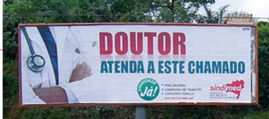
As placas atingiram, também, a opinião pública

• SESAB - Campanha Dignidade Já. O Sindimed promove ampla campanha de mídia pela valorização do médico. Após uma série de assembleias, muitas das quais com mais de 100 médicos, aprovou-se um novo PCCV para os servidores estaduais da saúde, que passou a valer em 2009.