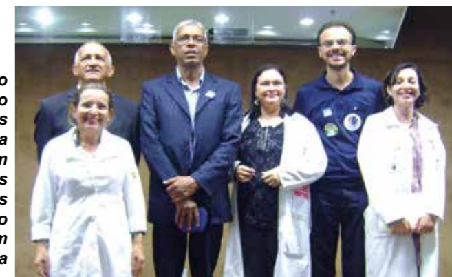
Diretores do Sindicato dos Médicos da Bahia participaram de protestos contra vetos ao Ato Médico, em Brasília

● LUTA PELO ATO MÉDICO – O Sindimed enviou uma delegação de seis médicos para acompanhar a votação no Congresso Nacional dos vetos de Dilma ao Ato Médico. Durante todo o dia, os baianos se juntaram aos médicos dos demais estados brasileiros para pressionar os parlamentares. O fisiologismo falou mais alto, entretanto, e os parlamentares mantiveram os vetos presidenciais.