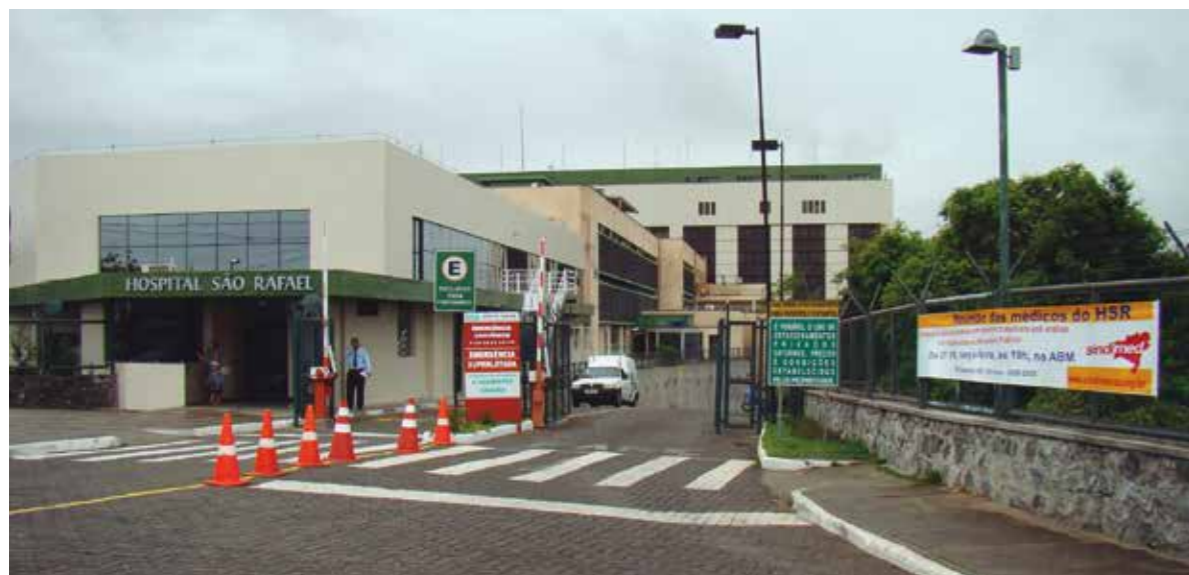
Acordo garante passivo trabalhista de R$ 26 milhões