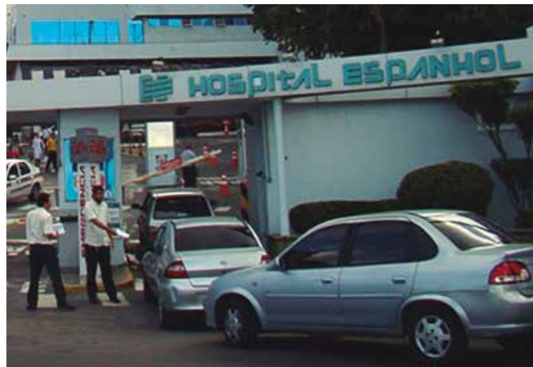
Panfletagem em frente ao Hospital Espanhol, na manhã do primeiro dia de greve, informou à população a suspensão do atendimento na emergência