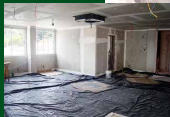
A área interna do novo prédio já entrou em fase de acabamento