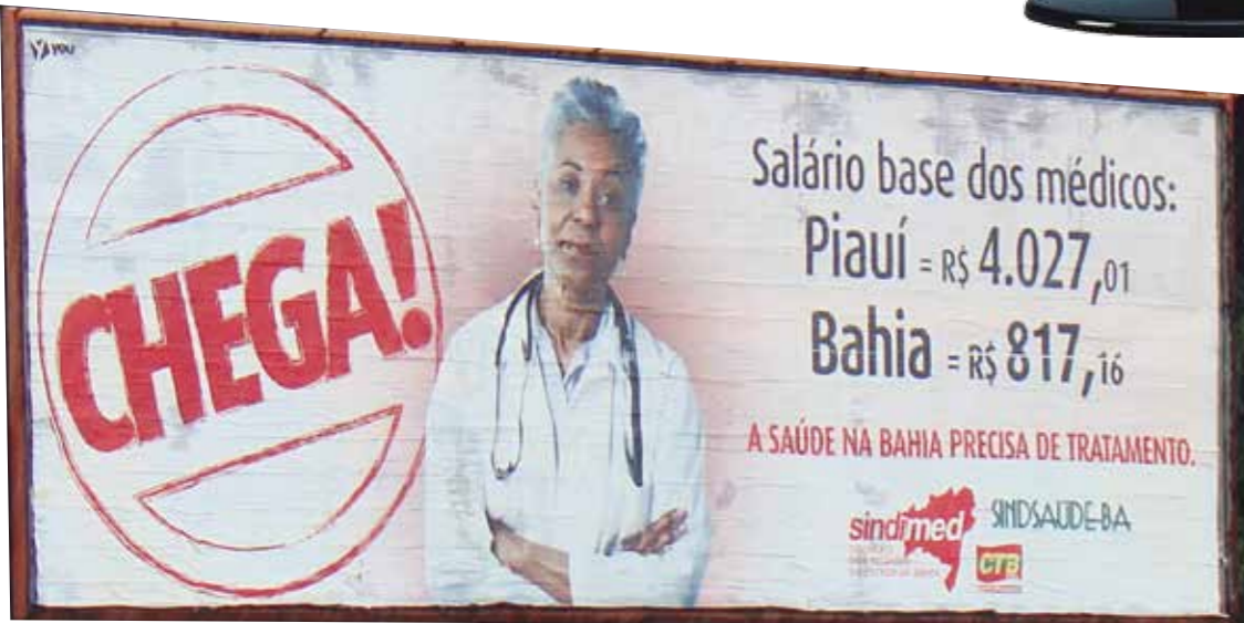
“Chega, a saúde da Bahia precisa de tratamento”, outdoor da campanha dos médicos